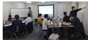
昨年度のバイオデザイン・ワークショップ

ワークショップでは講義とワークを通じて、バイオデザインの基となっているデザイン思考、現場におけるニーズのを見つけ方、ニーズステートメントの作成方法、ブレインストーミングによるアイデア創出方法など Identify と Inventフェーズを中心に体験いただきます。本ワークショップを通じて、現場のニーズを捉えた商品・サービスの開発の全体像を設計できるようになります。奮ってご参加ください。