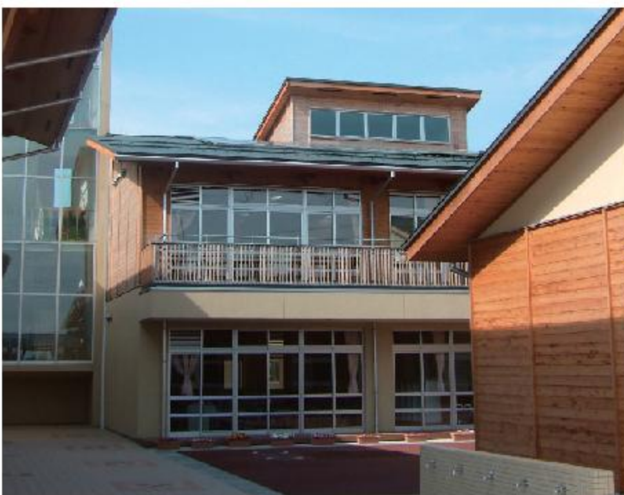
春江東小学校(福井県坂井市)