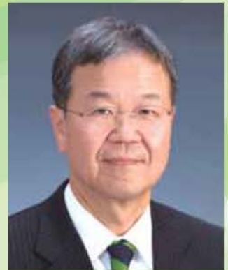
講師/戸田 雄三氏 (富士フィルム株式会社 取締役・常務執行役員)